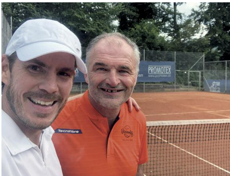
Auf dem Tennisplatz mit Stéphane Chapuisat.